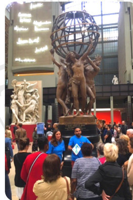
Médiateurs de l'INSPÉ, Orsay 2019

Un travail est aussi mené auprès des étudiants de la filière Médiation Culturelle pour leur proposer une sensibilisation au musée, et une expérience de médiateur sur terrain, auprès de nos publics.